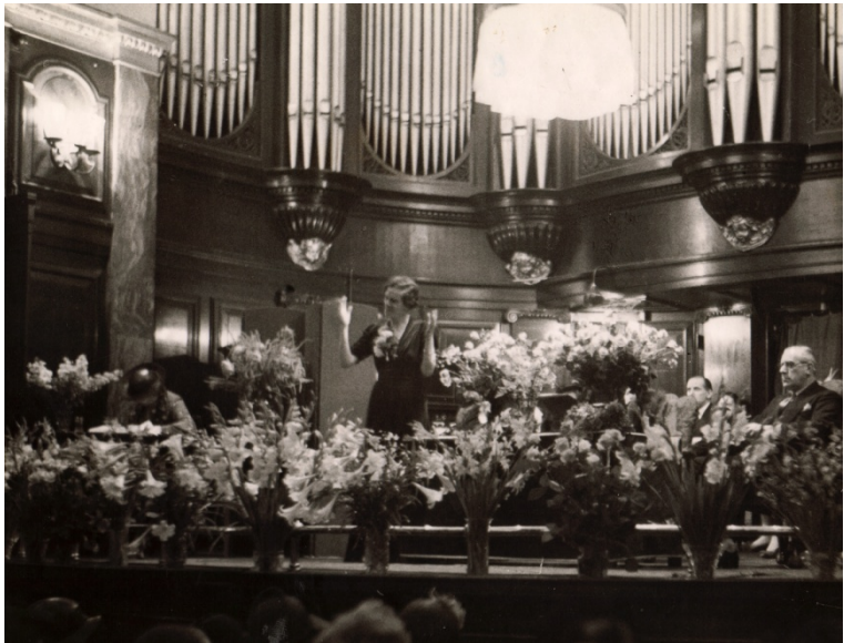
Red Cloud Spreekt

Heel vaak heb ik zitten nadenken over welke krachten er die gedenkwaardige avond werden gebundeld, om deze man naar Queen's Hall te leiden. Misschien was het eenvoudigweg zijn vrouw die trouw over hem waakt, zoals ze altijd in het verleden had gedaan.