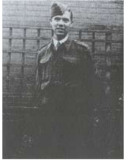
Ik weet niet meer zeker hoe oud ik was toen deze foto werd genomen, maar ik denk dat ik begin twintig was. Oh, had ik nou maar een datum op mijn foto's gezet!