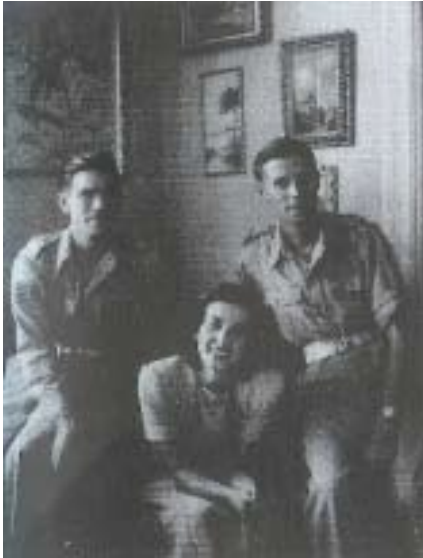
Het lijkt wel gisteren dat deze foto werd genomen. In feite is was het tijdens de donkere dagen van de laatste wereldoorlog. Op de foto sta ik met twee vrienden, in Griekenland. De jonge dame, een begenadigd pianiste, woonde met mij een verbluffende materialisatie séance bij.